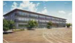
柏市立田中小学校第一校舎建替工事イメージ図

概要: 校舎の建替工事、 渡廊下設置工事及び外構工事 工期: 令和3年1月~令和4年3月 (供用開始 令和4年4月)