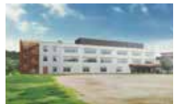
柏市立柏の葉小学校校舎増築工事イメージ図

概要: 校舎の増築工事及び 既存校舎改修工事 工期: 令和3年1月~令和4年2月 (供用開始 令和4年4月)