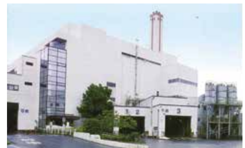
柏市清掃工場正面