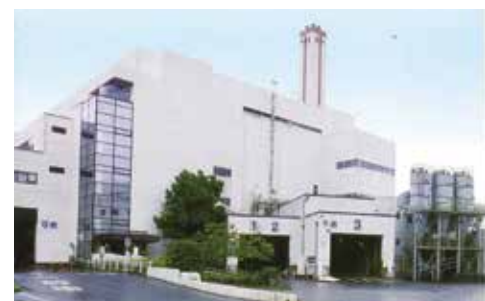
柏市清掃工場正面