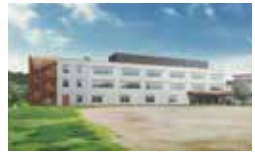
柏市立柏の葉小学校校舎 増築工事イメージ図

概要: 校舎の増築工事及び 既存校舎改修工事 工期: 令和3年1月~令和4年2月 (供用開始 令和4年4月)