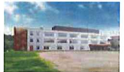
柏市立柏の葉小学校校舎 増築工事イメージ図

概要: 校舎の増築工事及び 既存校舎改修工事 工期: 令和3年1月~令和4年2月 (供用開始 令和4年4月)