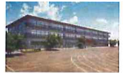
柏市立田中小学校第一校舎 建替工事イメージ図

概要: 校舎の建替工事、 渡廊下設置工事及び外構工事 工期: 令和3年1月~令和4年3月 (供用開始 令和4年4月)