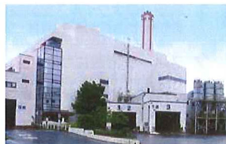
柏市清掃工場正面